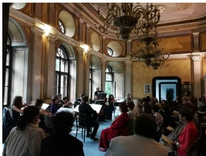
(Gernyeszegi Teleki Kastély)